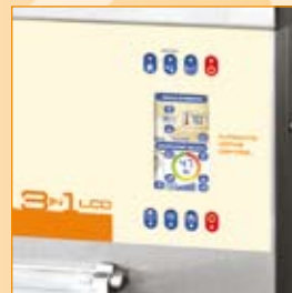
► SCHERMO LCD TOUCH SCREEN LCD TOUCH SCREEN MONITOR ECRAN TACTILE LCD