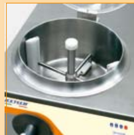
► SISTEMA DI AGITAZIONE TANK PARTICULARITE CUVE