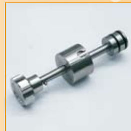
► PARTICOLARE RUBINETTO TAP PARTICULARITE ROBINET